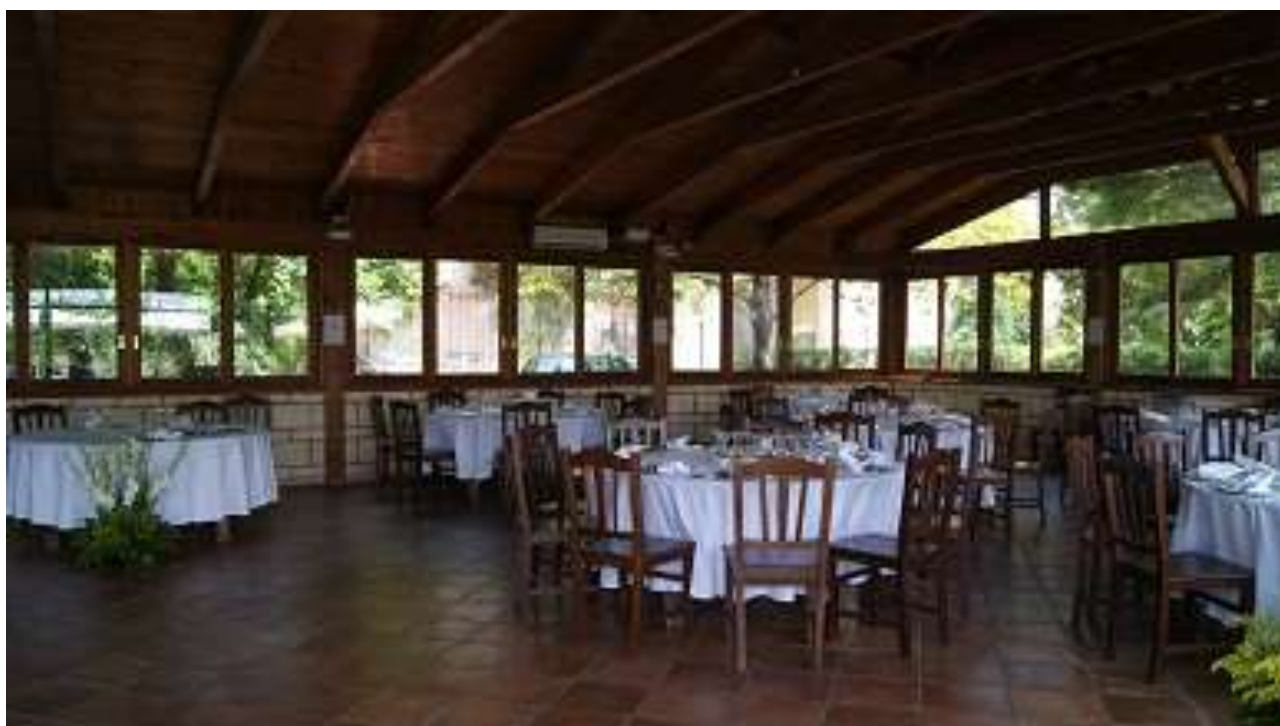
Sala da pranzo "Eucaliptus"