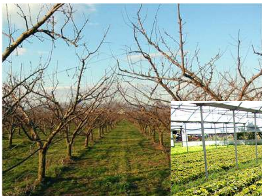
Coltivazioni “ Biologiche/ Biodinamiche”

nasce nel cuore della ridente e fertile pianura di Terra di Lavoro, nelle campagne dell’antica Capua, gloriosa città della “Campania Felix” che, a giudizio di Cicerone, fu seconda tra tutte le città italiche alla sola Roma.