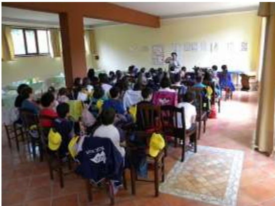
Lezione di fattoria didattica