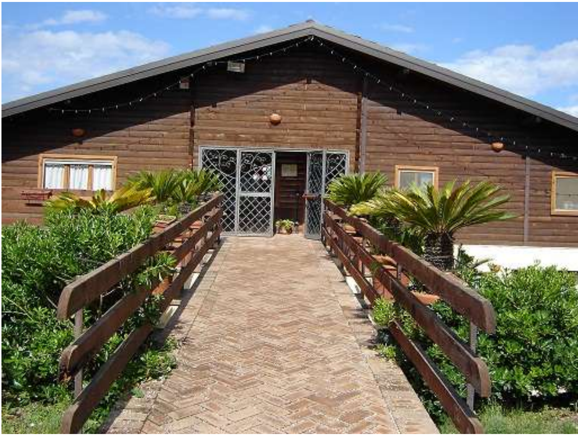
Sala da pranzo "Cycas"