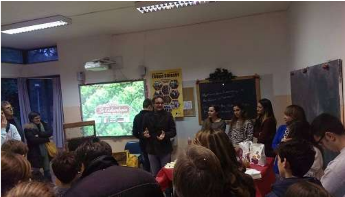
Lezione di agricoltura biologica